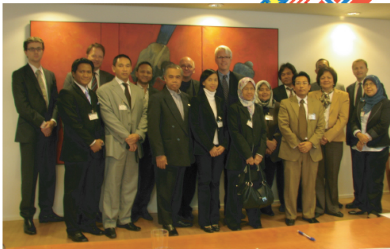
Delegasi eP dan wakil Agensi Pengurusan Awam dan e-Kerajaan Norway atau DIFI. Sistem ePerolehan sering dijadikan rujukan kepada inisiatif e-Kerajaan negara luar.