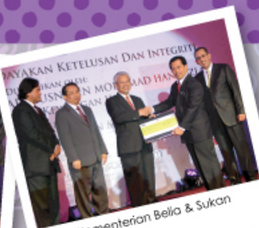
Kementerian Belia & Sukan