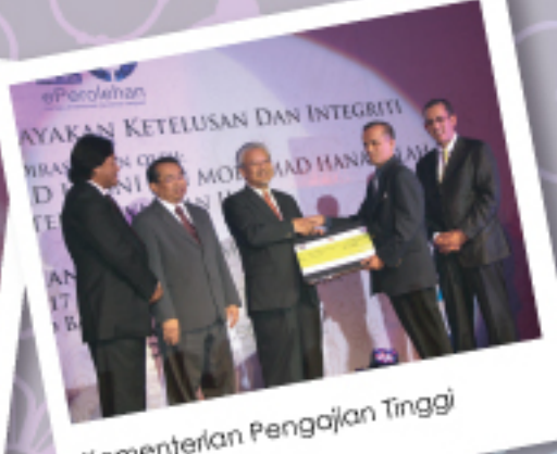
Kementerian Pengajian Tinggi