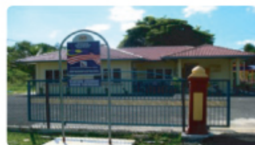
Medan Infodesa (MID)