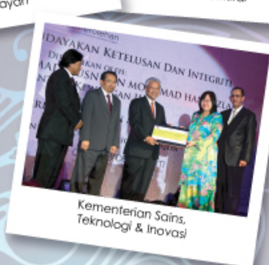
Kementerian Sains, Teknologi & Inovasi