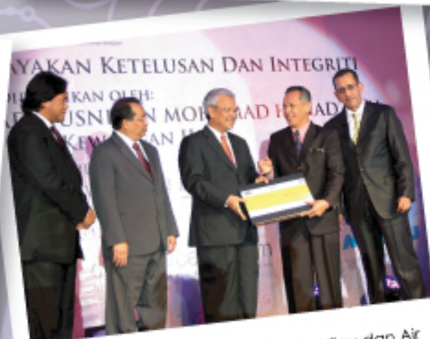
Kementerian Tenaga, Teknologi Hijau dan Air