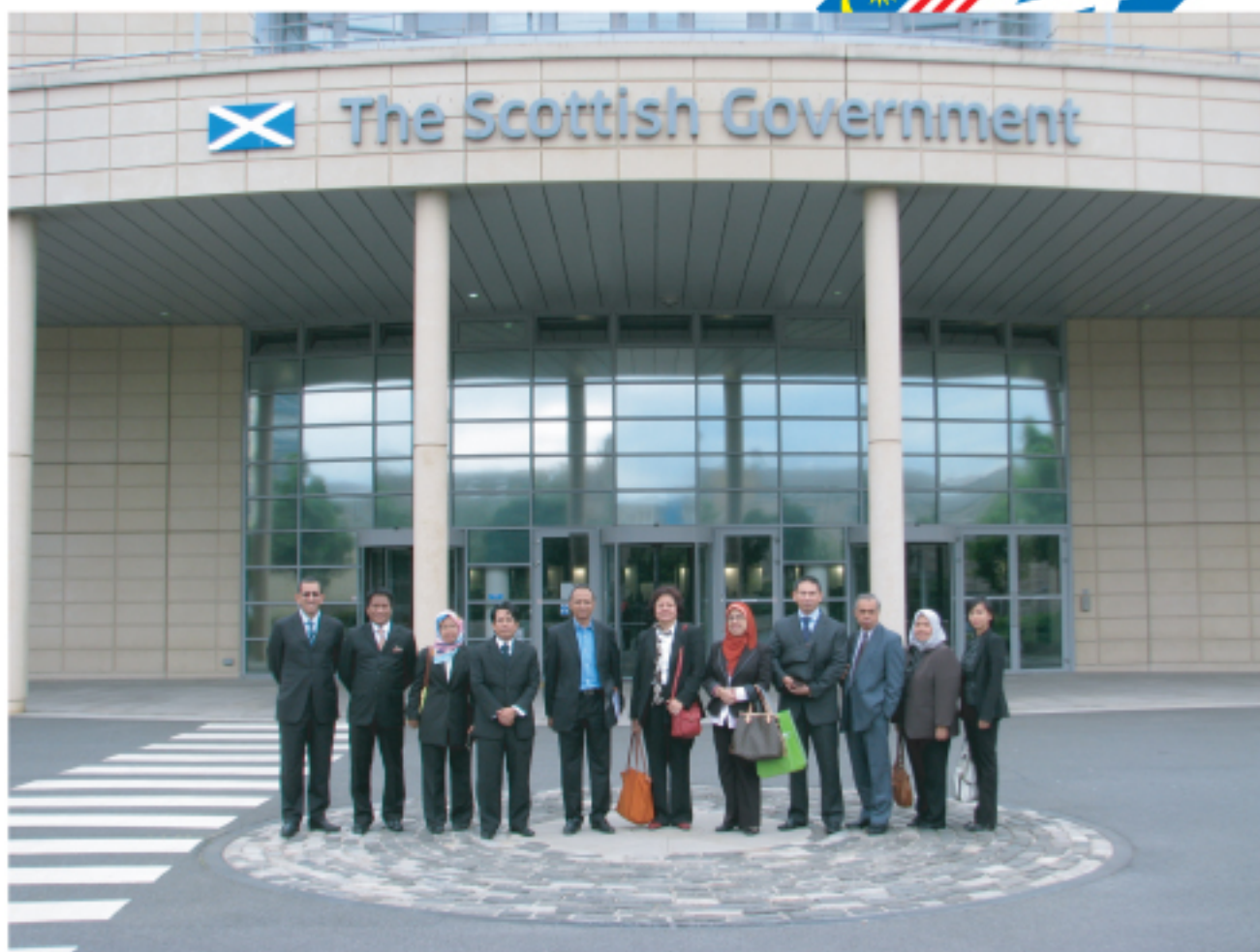
Delegasi eP bergambar di luar Bangunan Kerajaan negeri Scotland.