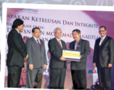
Kementerian Sumber Manusia