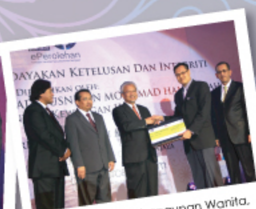
Kementerian Pembangunan Wanita, Keluarga dan Masyarakat