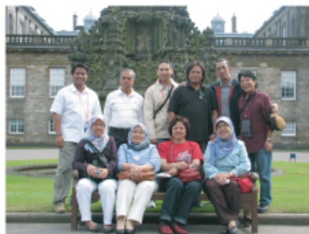
Lawatan ke Scotland 2010.