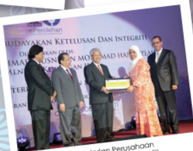
Kementerian Perusahaan Perladangan dan Komoditi