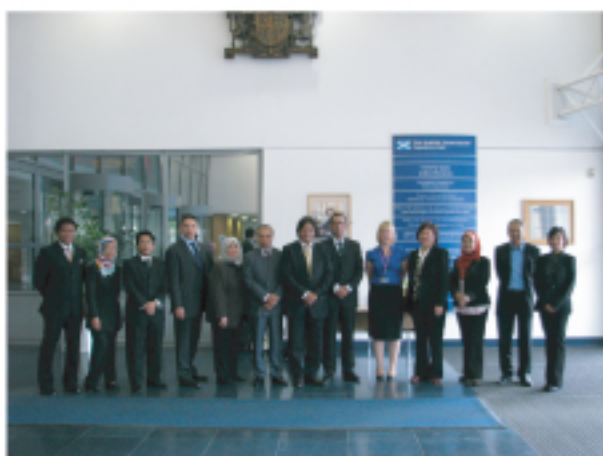
Bersama wakil Perolehan Awam atau eProcurement Scotland