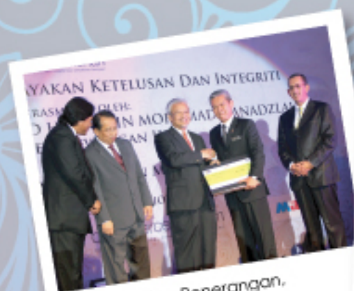
Kementerian Penerangan, Komunikasi & Kebudayaan