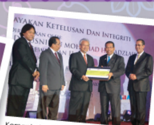
Kementerian Wilayah Persekutuan & Kesejahteraan Bandar