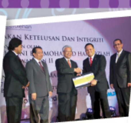
Jabatan Perdana Menteri