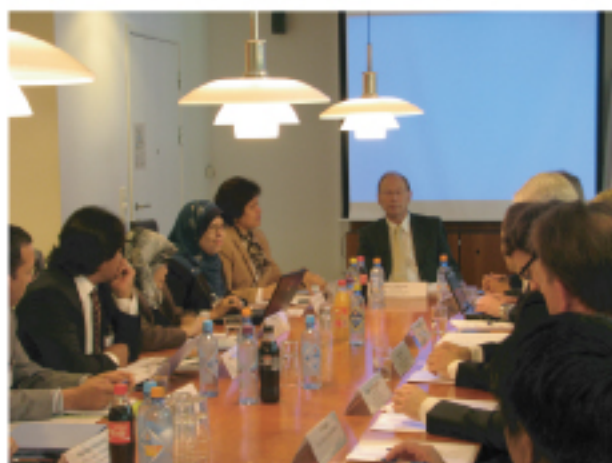
Delegasi eP dan DIFI Norway sewaktu perbincangan dua hala berkaitan persamaan sistem perolehan elektronik kedua-dua negara.