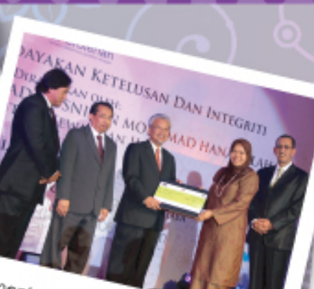
Kementerian Kerja Raya