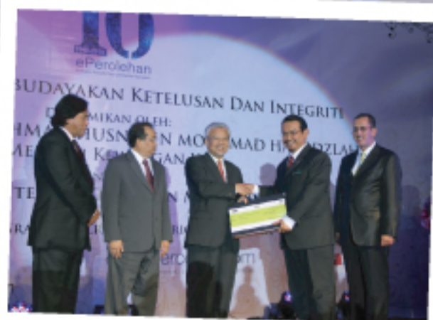
Kementerian Luar Negeri