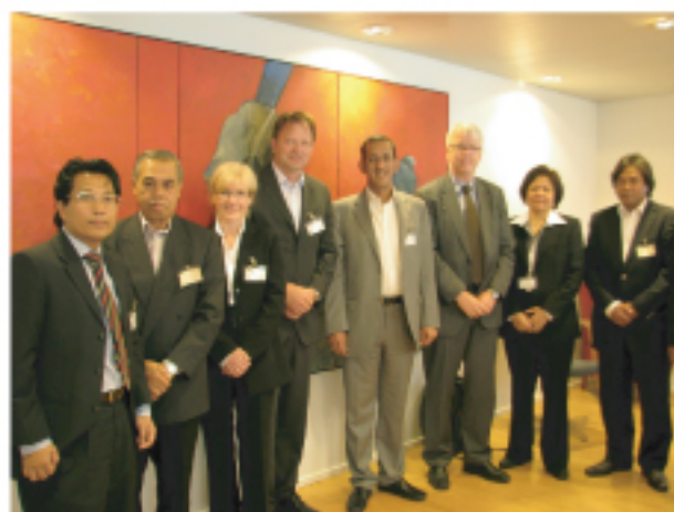
Tunggak utama sistem ePerolehan Malaysia dan DIFI, Norway.