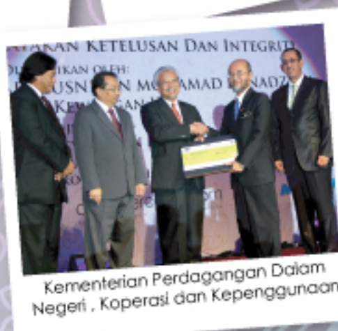
Kementerian Perdagangan Dalam Negeri, Koperasi dan Kepenggunaan