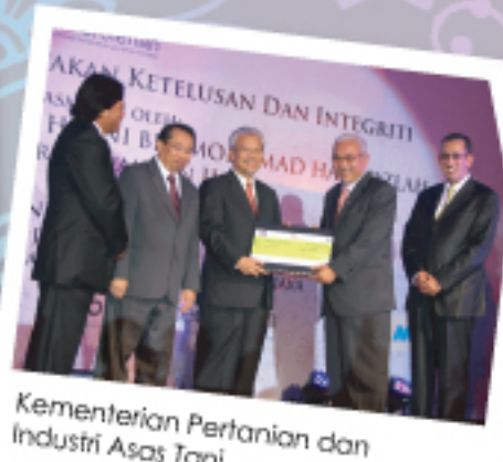
Kementerian Pertanian dan Industri Asas Tani