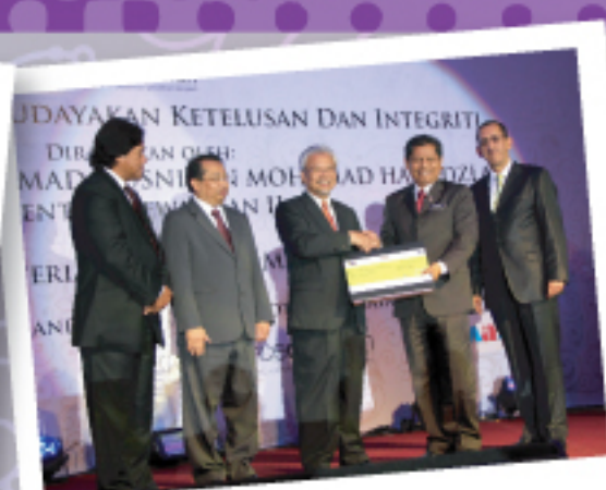
Kementerian Dalam Negeri