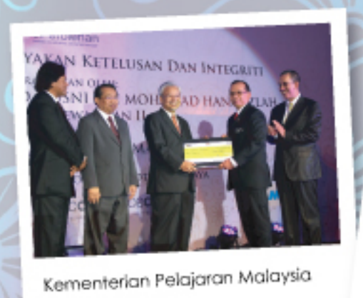
Kementerian Pelajaran Malaysia