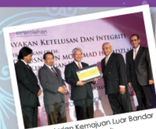
Kementerian Kemajuan Luar Bandar dan Wilayah