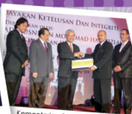
Kementerian Sumber Asli dan Alam Sekitar