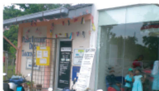
Pusat Internet Desa (PID)