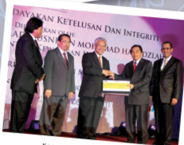
Kementerian Perdagangan Antarabangsa dan Industri