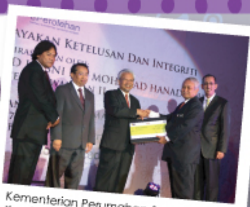
Kementerian Perumahan & Kerajaan Tempatan