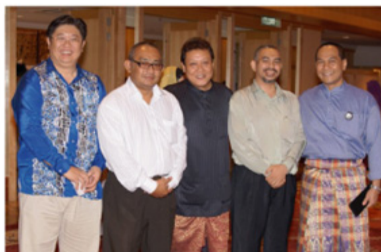
Gambar atas dan bawah: Antara petugas jamuan tersebut.