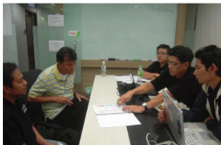
Gambar diatas & dibawah: Unit ep dan Commerce Dot Com membuat pemeriksaan teliti sepanjang latihan berlangsung.

Commerce Dot Com bertanggungjawab dalam menyediakan kemudahan hosting facility bertaraf dunia dan rangkaian infrastruktur yang mampu membantu pengguna menggunakan sistem ePerolehan dengan mudah. Buat masa kini, portal ePerolehan boleh menerima lebih 100,000 transaksi dalam sebulan dengan anggaran purata nilai perolehan sehingga RM1.8 bilion.