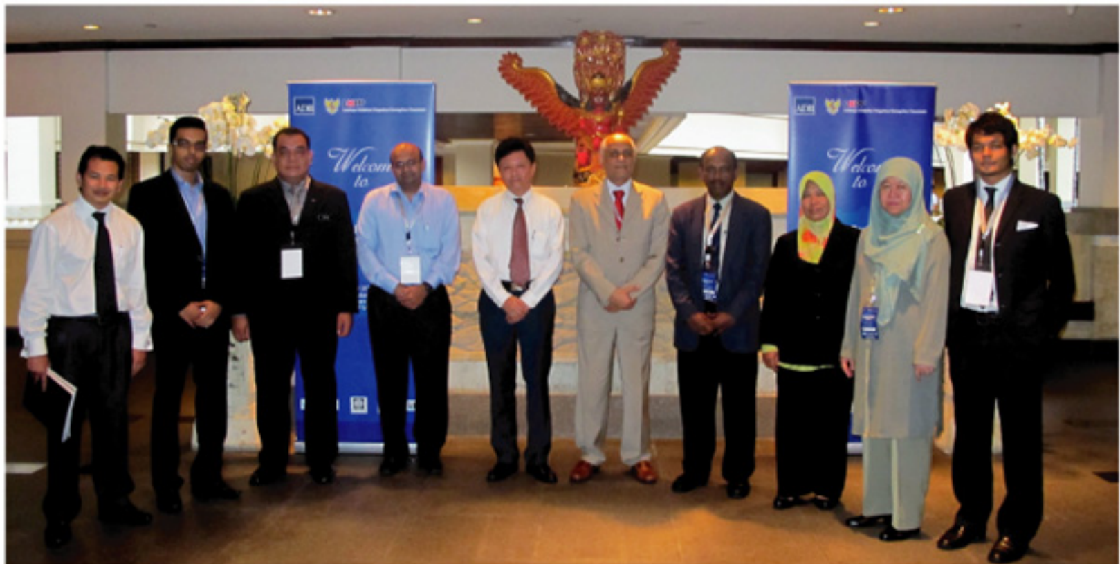
Delegasi Malaysia bersama urusetia penganjur ADB

Hampir 15 negara mempunyai pengalaman lebih daripada 5 tahun dalam pelaksanaan perolehan Kerajaan elektronik termasuk Malaysia. Daripada jumlah tersebut, didapati hanya dua (2) negara yang mempunyai pengalaman lebih 10 tahun iaitu Korea Selatan dan Malaysia. Dari segi pelaksanaan pula, hanya Malaysia mempunyai skop yang lebih meluas ( Decentralize ) kepada lebih 2,500 Agensi Kerajaan. Projek eP juga adalah antara projek yang lengkap dari segi modul untuk melaksanakan perolehan Kerajaan secara elektronik sepenuhnya. Projek ePerolehan mendapat maklum balas positif daripada banyak negara untuk mempelajari pengalaman pelaksanaannya di Malaysia.