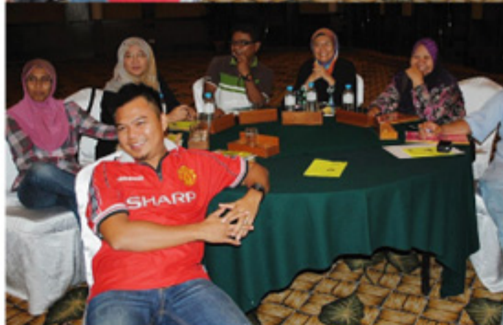
Sekitar aktiviti "Team Building" Unit eP & CDCSB.