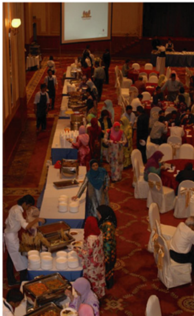
Tetamu mengambil juadah disediakan.